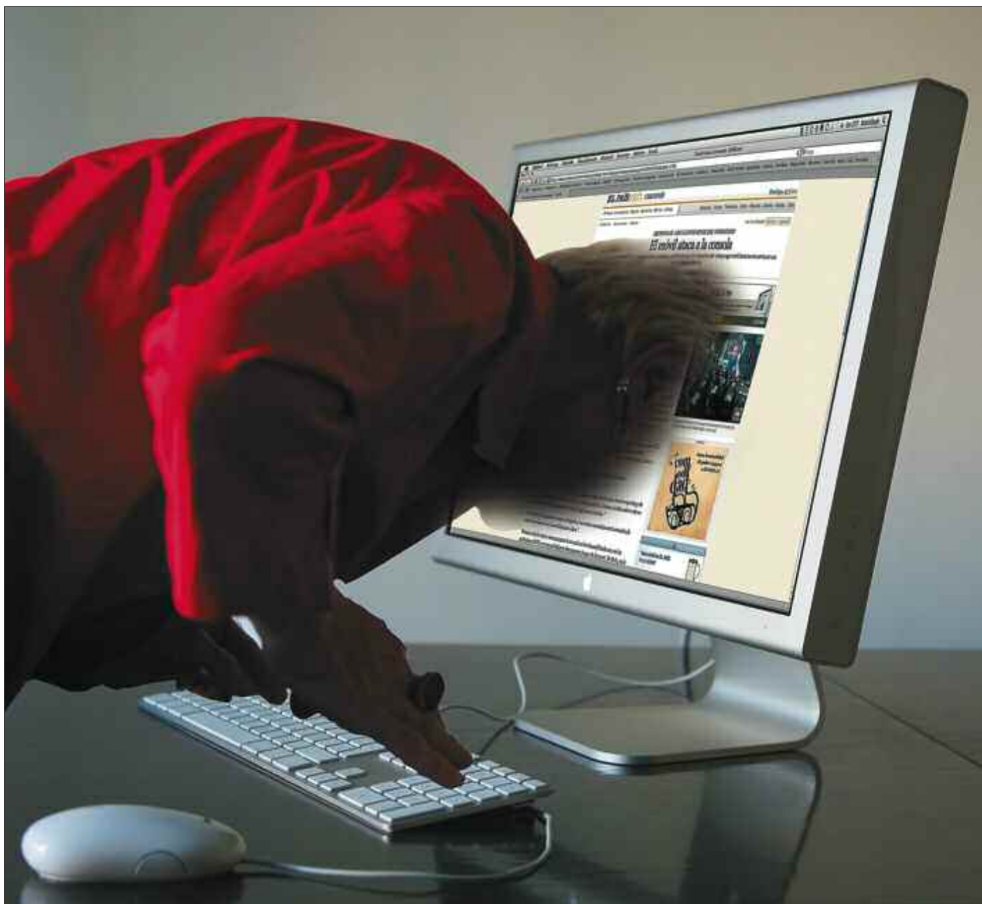
Internet como canal donde se manifiestan patologías ya existentes.