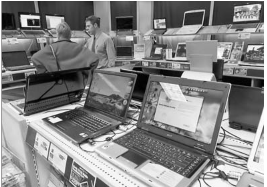
Las tiendas de informática se resienten por la caída del consumo como consecuencia de la crisis.