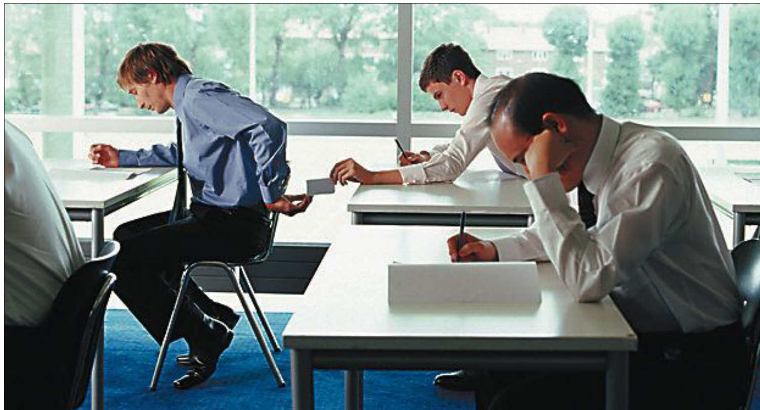
Empresarios y ejecutivos toman notas en un aula de una escuela de negocios.

seguir más y más cosas, mejor salario, mejor trabajo... Acabas pagando por los contactos y no por los conocimientos", añade. Para Domingo, la solución pasa por volver a contenidos más clásicos, fomentar la reflexión sobre la ética empresarial y estudiar tanto casos de éxito como de fracaso para no caer dos veces en la misma trampa.