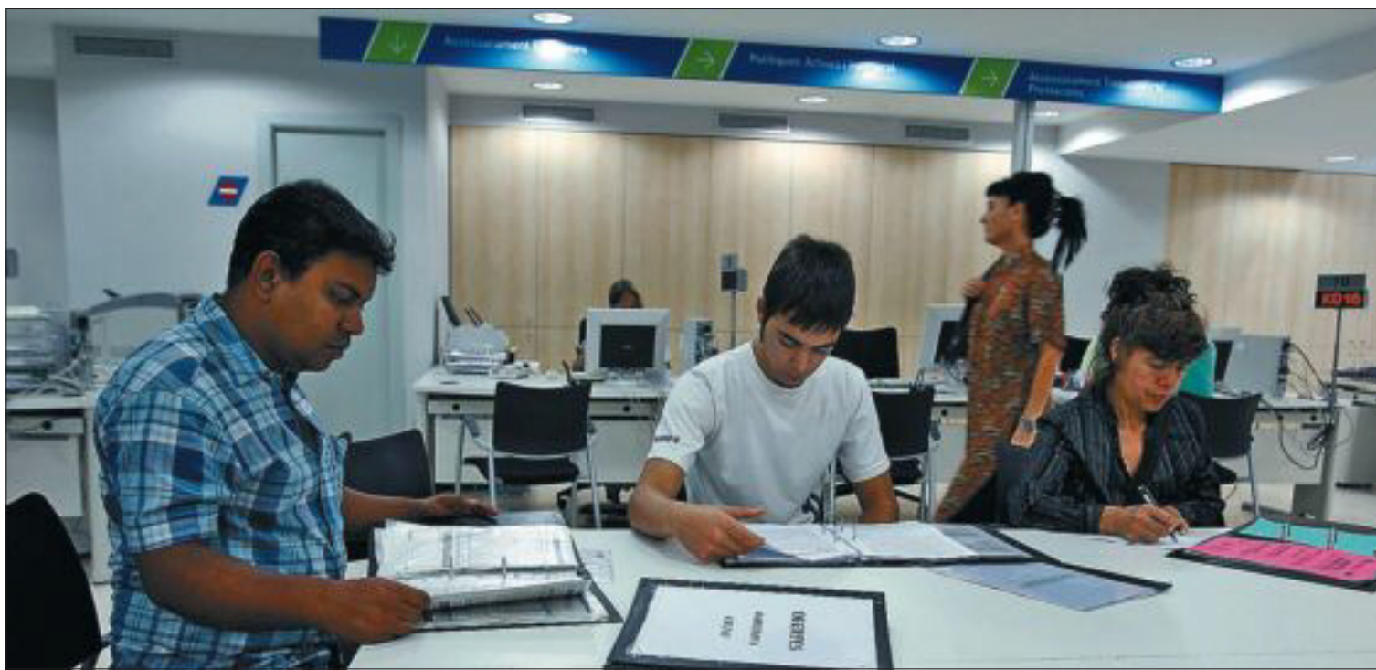
Unos parados consultan las ofertas de trabajo en una oficina de empleo catalana.

“Muchos de los empleos perdidos no van a recuperarse. Especialmente en construcción, turismo y servicios. La formación de estos trabajadores es baja y su edad elevada, por lo que su empleabilidad en otras actividades se reduce”, dice Sandalio Gómez, profesor del IESE, quien coincide además con